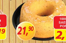
Bolo de Fuba kg