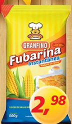
Fubarina Granfino 500g