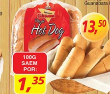
Pão de Hot Dog Guanabara kg