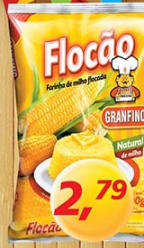
Flocão Granfino 500g