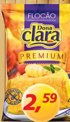
Flocão Dona Clara 500g