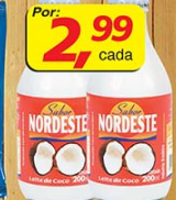
Leite de Coco Sabor do Nordeste 200ml