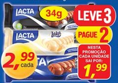
Chocolate Lacta Diamante Negro, Ao Leite ou Lacta 34g