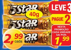
Chocolate Lacta Sstar 40g