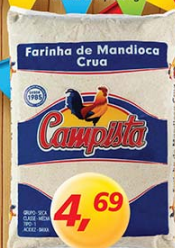
Farinha Completa kg