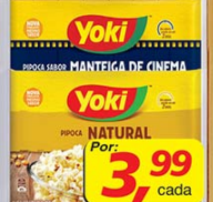
Pipoca de Micro-ondas Yoki 96g/100g