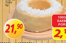
Bolo de Coco kg