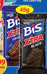
Chocolate Bis Xtra Lacta 45g

LEVE 3 PAGUE 2 NESTA PROMOÇÃO CADA UNIDADE SAI POR: 1,99