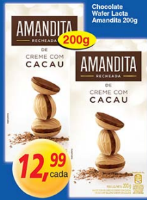
Chocolate Wafer Lacta Amandita 200g