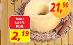
Bolo de Aljmo kg