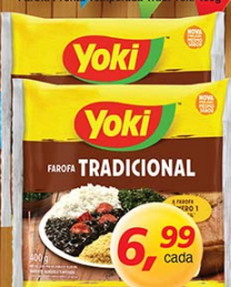
Farofa Pronto Temperada Trad. Yoki 400g