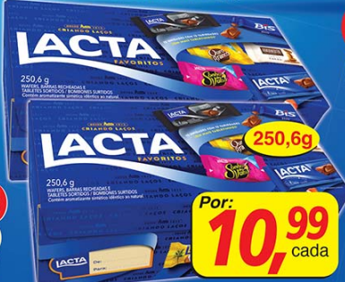
Bombom Lacta Favoritos 250,6g