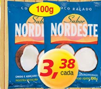
Coco Ralado Unido e Adoçado Sabor do Nordeste 100g