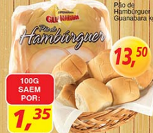
Pão de Hambúrguer Guanabara kg