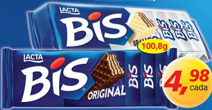
Chocolate Lacta Bis 100,8g