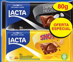
Chocolate Lacta 80g