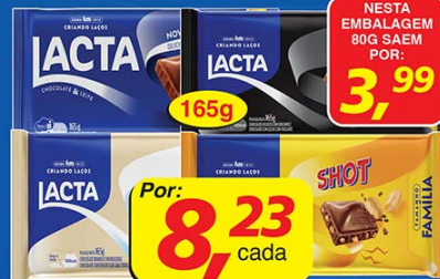
Chocolate Lacta 165g