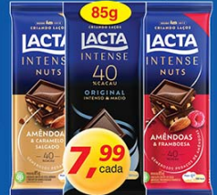
Chocolate Intense 40% Lacta 85g