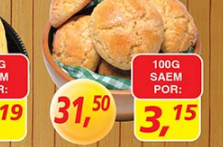
Cavaca de Milho kg