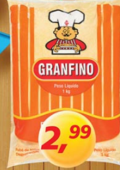
Fuba Granfino kg