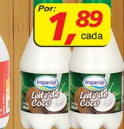
Leite de Coco Imperial 200ml