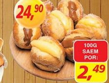
Miri Sonho Creme ou Doce de Leite kg