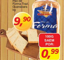
Pão de Forma Trad. Guanabara kg