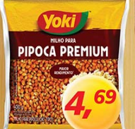
Milho de Pipoca Yoki 400g