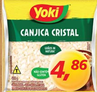
Canjica Branca Yoki 400g