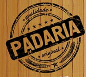
Pão Doce kg