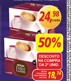
Nescafé Doce Gusto c/ 16 Cápsulas