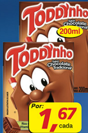
Achocolatado Toddinho Trad. 200ml