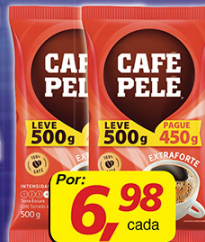
Café Pelé Leve 500g Pague 450g