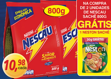
Achocolatado Nescau 2.0 Sachê 800g