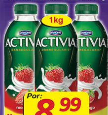
Leite Fermentado Activia Trad. Danone 1kg