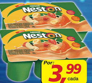
Iogurte Polpa Neston 540g