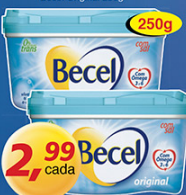
Becel Original 250g