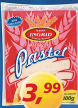
Massa p/ Pastel Ingrid 400g