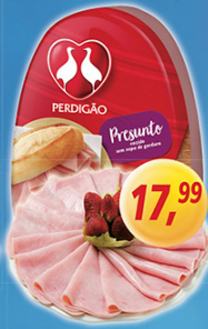
Presunto Cozido Perdigoão kg