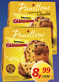
Panetone Chocolate ou Frutas Guanabara 500g