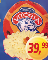
Queijo Bola Vitória kg