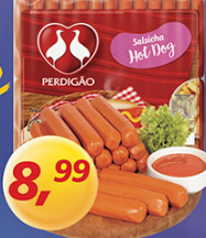
Salsicha Hot Dog Perdigoão kg