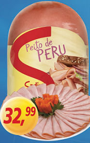
Peito de Peru Defumado Sadio kg