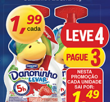
Danoninho Para Levar 70g