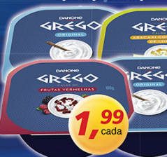
Iogurte Grego Danone 100g