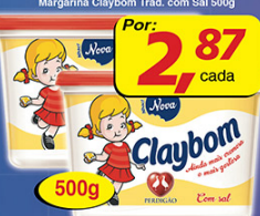
Margarina Claybom Trad. com Sal 500g