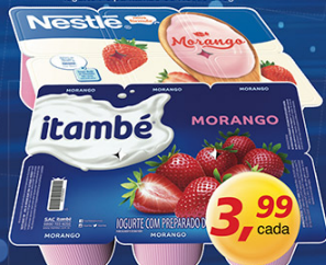
Iogurte Polpa Itambé ou Nestlé 540g