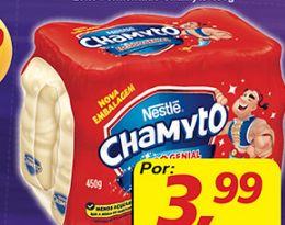
Leite Fermentado Chamyto 450g