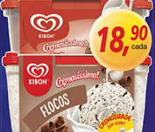
Sorvete Kibon Cremosissimo Chocaton ou Flocos 1,5 Litro