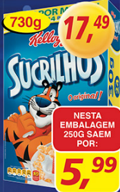
Sucrilhos Original Kellogg's 730g