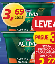
Leite Fermentado Activia Café da Manhã 170g