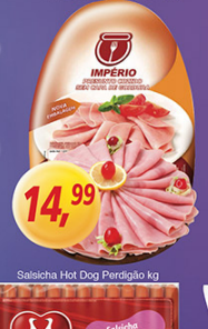
Presunto Cozido Império kg