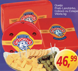
Queijo Prato Lanchinho, Coboco ou Estalepo Vitória kg