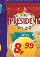
Queijo Ralado President 100g