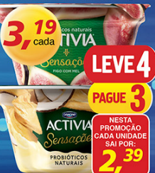
Leite Fermentado Activia Sensações 120g