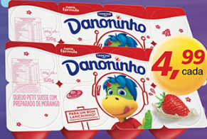
Petiti Suisse Danoninho 320g