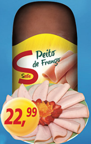
Peito de Frango Sadio kg