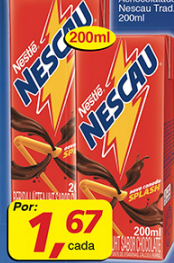
Achocolatado Nescau Trad. 200ml