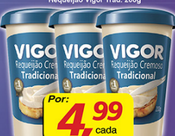
Requeijão Vigor Trad. 200g