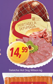
Mortadela Defumada Sadio kg