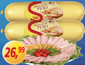
Bianquet de Peru Sadio kg