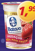
Iogurte Pedacos Batavo 100g