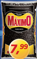
Feijão Preto Máximo kg