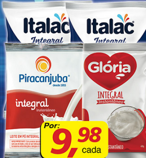
Leite em Pó Inst: Integral Glória, Italaç ou Piracanjuba Sachê 400g