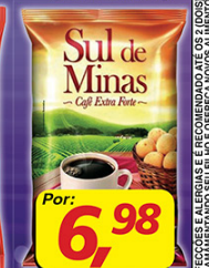
Café Sul de Minas 500g