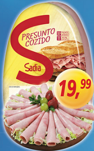
Presunto Cozido Sadio kg