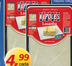
Massa p/ Lasanha Napoles 500g