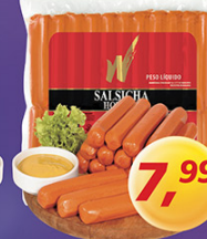
Salsicha Hot Dog Wilson kg