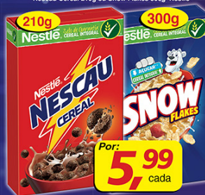
Nescau Cereal 210g ou Snow Flakes 300g Nestlé