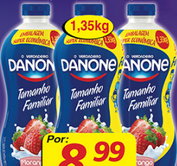
Iogurte Danone Trad. 1,35kg