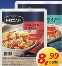
Capeletti ou Ravioli Mezzani 400g