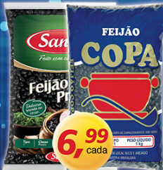
Feijão Preto Copa ou Sanes kg