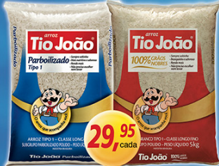
Arroz Branco ou Parbolizado Máximo 5kg