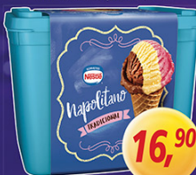
Sorvete Nestlé Napolitano 1,5 Litro