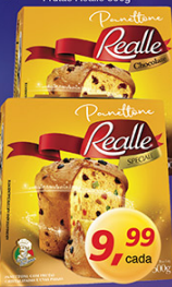
Panetone Chocolate ou Frutas Realle 500g