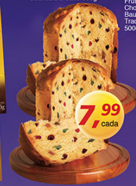
Panetone Frutas Guanabara Sapo 500g